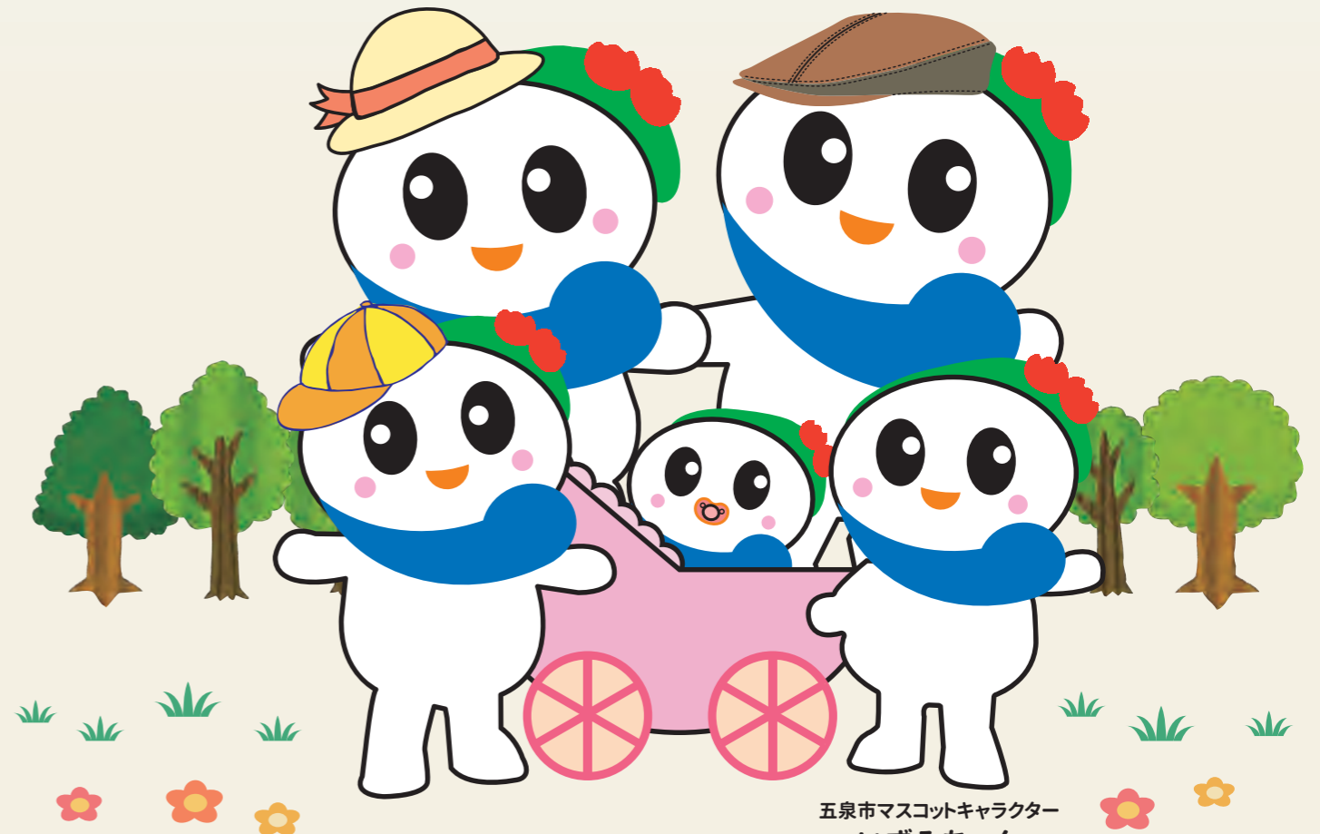
五泉市マスコットキャラクター いずみちゃん

妊娠・出産からはじまる子育て支援や医療費助成、豊富なセミナーなど 子育てしやすい支援体制の充実と、子どもの心を育む恵まれた自然環境を いかし「安心して子育てができるまちづくり」を進めています。